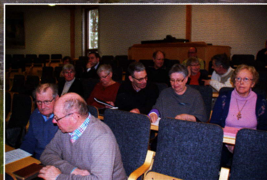
Hembygdsparlamentet samlades i Karis s. 4