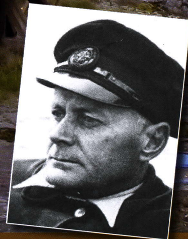
Ragnar Granit 50 år sedan Nobelpriset s. 12-13