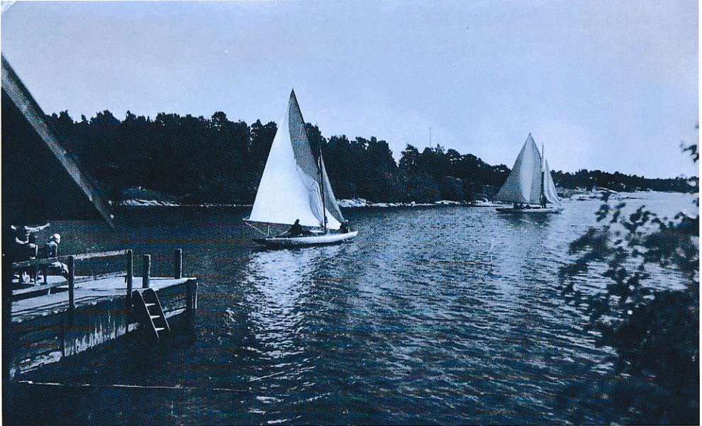
Segling i Vikminne.