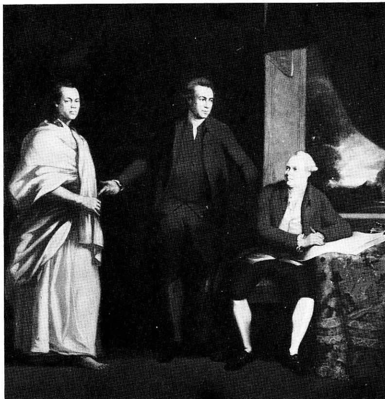
Solander (sittande) och Banks med Omai.

Kopia efter oljemålning av William Parry 1775, utförd 1966 för Vetenskapsakademiens räkning. Originalen i Parham House, Sussex.